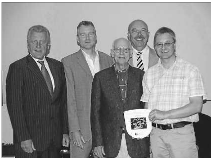
Für die Broschüre „Gut durch Asperg mit Rollstuhl, Rollator und Kinderwagen“ wurde der Zirkel Verkehr ausgezeichnet.

Barrierefrei durch Asperg für Rollstuhlfahrer und Menschen mit Rollator war ebenfalls ein großes Aufgabenfeld dieses Zirkels. Hierzu wurden die öffentlich zugänglichen Räume von Behörden und Ladengeschäften bewertet. Bewertet im Hinblick auf Geeignetheit für Rollstuhlfahrer und Kinderwagen sowie das Vorhandensein einer Kundentoilette und Parkmöglichkeiten für Rollstuhlfahrer. Ergebnis war die Broschüre „Gut durch Asperg mit Rollstuhl, Rollator und Kinderwagen“. Für sein Engagement wurde der Zirkel sogar ausgezeichnet und die Stadt Asperg als vorbildlich eingestuft.