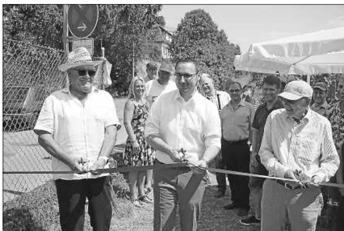
Eröffnung des Fußweges zum Hohenasperg

Der Zirkel Verkehr machte es sich zur Aufgabe, Vorschläge für die Reduzierung des innerstädtischen Verkehrs auszuarbeiten. Er begleitete auch wesentlich die Planungen zur Ostumfahrung. Schon früh machte der Zirkel auch den Vorschlag, den Knotenpunkt in der Neuen Mitte beim Hotel und Restaurant Adler mit einem Kreisverkehr zu entzerren.