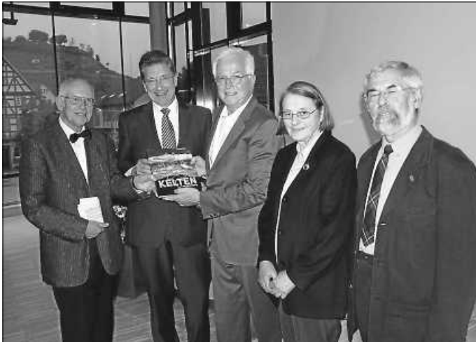
Die Keltengruppe war es auch, welche das Buch „Kelten am Hohenasperg“ herausgegeben hat.

Ermuntern durch die erfolgreiche Keltenausstellung wurde einige Jahre später von der sogenannten Keltengruppe das Buch „Kelten am Hohenasperg“ mit Beiträgen der Landesdenkmalpflege herausgegeben. Erstmals wurde damit ein Überblick von den einzigartigen Funden rund um den Hohenasperg mit Text und Bildern erstellt. 2010 wurden die Mitglieder der Keltengruppe für die Ausstellung und das Buch mit dem Archäologie-Förderpreis des Landes Baden-Württemberg ausgezeichnet.