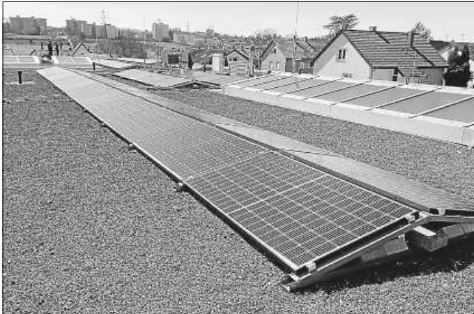
PV-Anlage auf der Kita-Grafenbühl

Auch die Stadt Asperg hat, wie in den letzten Monaten berichtet, inzwischen erste eigene PV-Anlagen auf kommunalen Dächern. Die Leistung der Anlagen reicht von 29,5 bis zu 54,6 kWp.