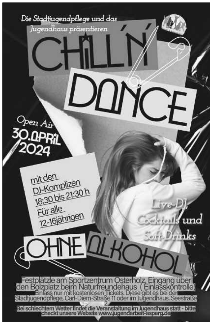
Plakat: Tobias Keller

Am 30. April wird in den Mai getanzt. Alle 12- bis 16-Jährigen sind herzlich eingeladen, auf das Festplätzle am Sportzentrum Osterholz zum Chillen und Tanzen zu kommen. Die Stadtjugendpflege und das Jugendhaus präsentieren die erste „Chill'n Dance“-Night von 18:30 bis 21:30 Uhr. Es gibt Cocktails und Softdrinks zu günstigen Preisen – alles ohne Alkohol.