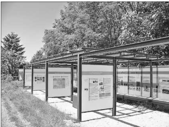
Auch der Infostand am Hohenasperg wurde von der Lokalen Agenda mitentworfen.

2013 konnten darüber hinaus die Infotafeln zur Geschichte des Hohenaspergs, von der Steinzeit bis zum Gefängnis, eingeweiht werden. Konzept und Layout erstellte ebenfalls die Keltengruppe. Sie begleitete auch die Genehmigungsverfahren, die Ausführung und aktivierte Sponsoren.