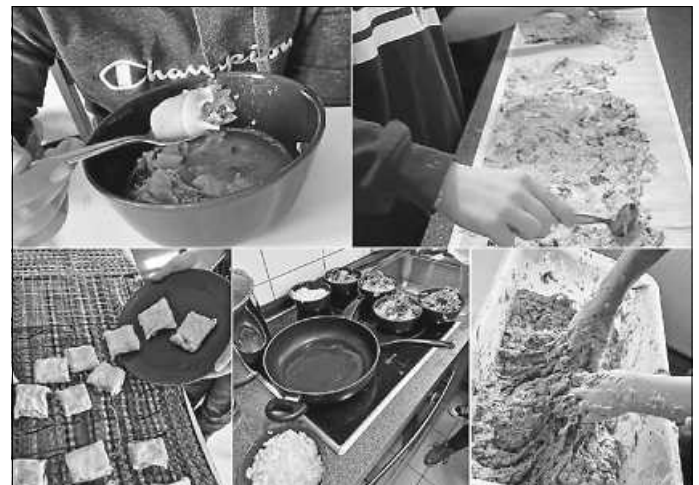
Maultaschen selbst gemacht

Und was wird im Ländle nicht nur in der Osterzeit gerne gegessen? Selbst gemachte Maultaschen! Daran versuchte sich beim „Schwaben Schbäschi“ am 27. März eine kleine Gruppe im Jugendhaus. Es wurde geschnippelt, gematscht, gewickelt und gekocht. Die fertigen Maultaschen wurden beim gemeinsamen Mittagessen probiert und auch für die Familien durfte noch eine große Portion mitgenommen werden.