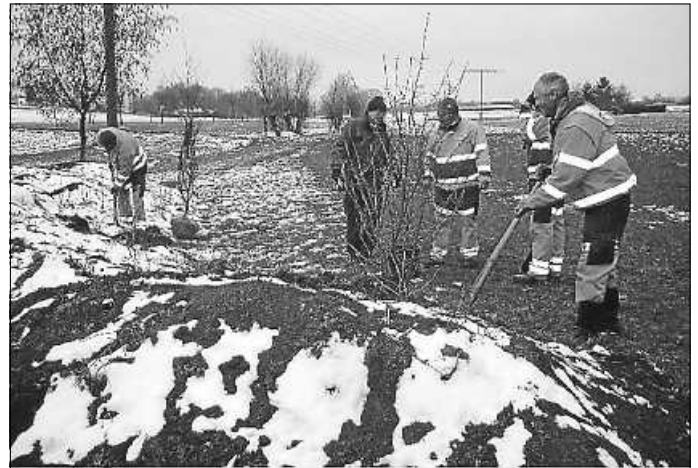
Baumpflanzaktion am Eselsbach

Nicht zuletzt das auch sehr umfang- und facettenreiche Führungsprogramm rund um den Hohenasperg geht zurück auf den Zirkel. Aber auch der Zirkel Natur und Umweltschutz begleitete zahlreiche Projekte. Jahrelang wurden die Wiesen am Eselsbach, die Spitzwiese und die Zimmerwiese gepflegt. Der Eselsbach wurde renaturiert, ein Retentionsbecken eingebaut und mit Hilfe des städtischen Bauhofs ein Feuchtbiotop angelegt.