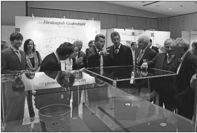
Keltenausstellung im Jahr 2008

Ermuntern durch die erfolgreiche Keltenausstellung wurde einige Jahre später von der sogenannten Keltengruppe das Buch „Kelten am Hohenasperg“ mit Beiträgen der Landesdenkmalpflege herausgegeben. Erstmals wurde damit ein Überblick von den einzigartigen Funden rund um den Hohenasperg mit Text und Bildern erstellt. 2010 wurden die Mitglieder der Keltengruppe für die Ausstellung und das Buch mit dem Archäologie-Förderpreis des Landes Baden-Württemberg ausgezeichnet.