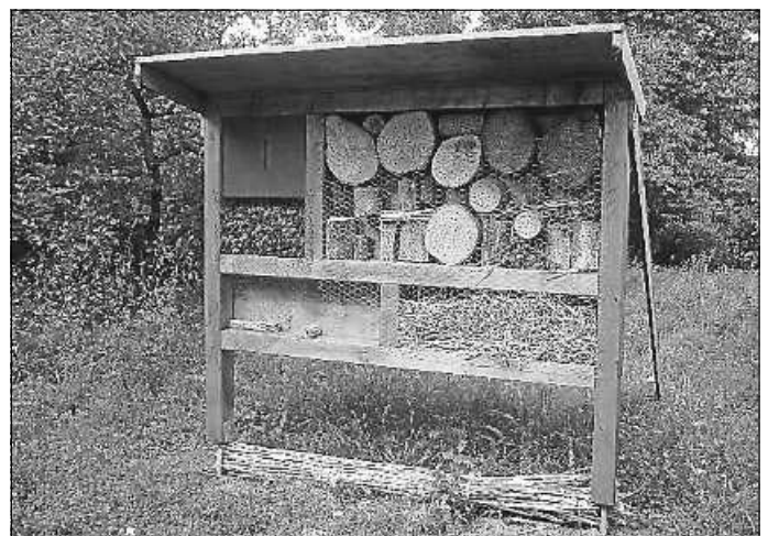
Wildbienenhotel am Eselsbach

In unmittelbarer Nähe wurde auch eines der ersten Wildbienenhotels in Asperg aufgestellt. Und in den Sommerferien wurde am Eselsbach ein Workshop für Schüler angeboten, bei welchem teilnehmende Kinder unter fachlicher Anleitung Vögel, Insekten, Pflanzen und Boden der örtlichen Flora und Fauna kennenlernen durften.