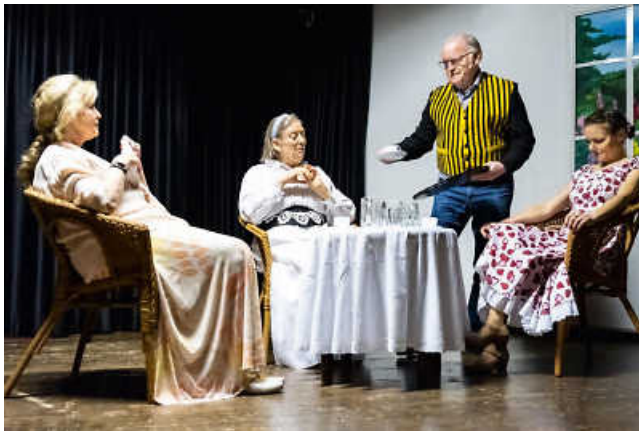
Fisch zu viert.