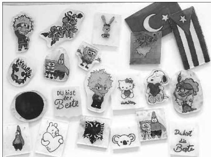
Diese tollen Schlüsselanhänger entstehen aus Schrupffolie.

So entstanden schon Schlüsselanhänger, Schneekugeln, Freundschaftsbänder, selbstbemalte Bilderrahmen, lustige Figuren, bunte Bilder, selbstgemachtes Slimy und vieles mehr. Und das ist lange nicht alles: Die Jugendbegleitungen haben noch viele tolle Ideen!