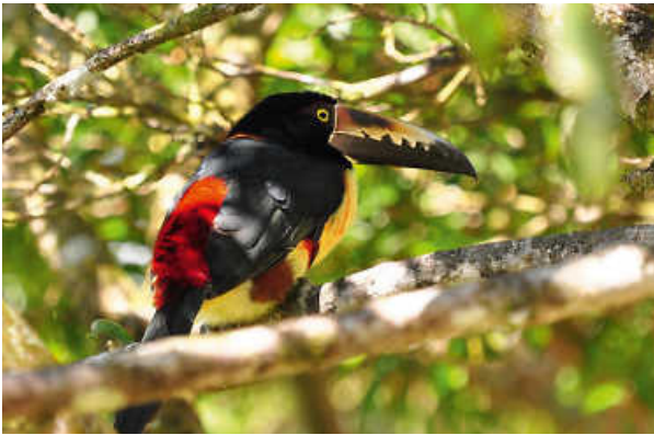
Costa Rica. Paradies auf Erden.