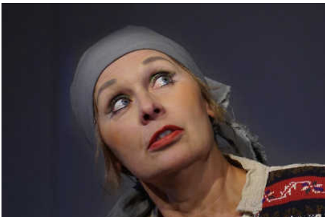
Dein Theater – Starke Frauen!

THEATER Dein Theater: Seid ihr noch zu retten? - „Starke Frauen“ Sonntag, 10.09. – 19.00 Uhr - Eintritt: € 15,- *****