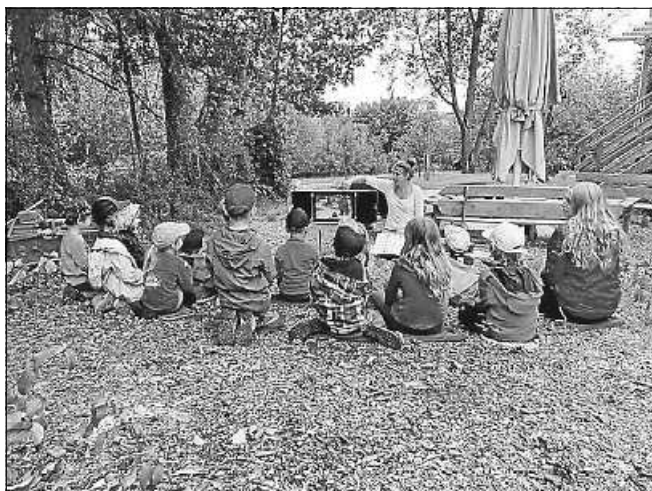
Die Waldwichtel vor dem Kamishibai-Erzähltheater.

Während die Sonne nach den Ferien nochmal zur Höchstform aufläuft, die Blätter Rot- und Gelbtöne annehmen und die süßen Zwetschgen von den Bäumen ins Gras fallen, um von den letzten wachen Bienen fleißig umsorgt zu werden, sitzen die Waldwichtel-Kinder auf der Wiese in einem Halbkreis um das Kamishibai-Erzähltheater, einem Holzrahmen für Bilder Geschichten.