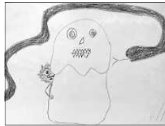
Keinehnung versteckt sich vor der Schlange.

Sie betrachten kunterbunte Zeichnungen und warten gespannt auf das Einsetzen von Dianas Stimme, die gleich eine ganz besondere Geschichte vorlesen wird: Die Geschichte von Keinehnung, die von den Kindern selbst illustriert und verfasst wurde.