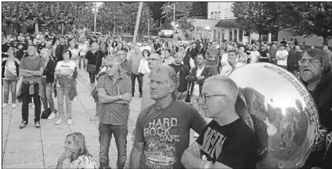
Per Livestream wurde die Veranstaltung auch auf den Rathausplatz übertragen.

Neu für die Öffentlichkeit waren dabei erste Pläne zu einer möglichen LEA-Besiedlung des Schanzackers, deren Herausgabe die Bürgerinitiative vom Justizministerium erwirkt hatte. Aus diesen geht hervor, wie eine Landeserstaufnahmestelle auf dem Schanzacker aussehen könne, sollte die Machbarkeitsstudie zu einem positiven Ergebnis kommen.