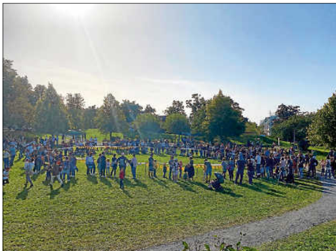
Im Mittelpunkt am Sonntag standen die Heavy Events.

Höhepunkt war jedoch der Sonntag. Weit mehr als 1.000 Besucher strömten bei herrlichstem Sonnenschein in den Bürgergarten.