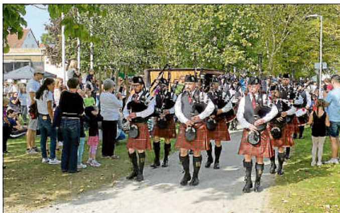
Highland-Parade mit den Heidelberg and District Pipes and Drums

Los ging es mit dem Entenrennen und somit mit der Eröffnung der Mini-Highlandgames. Natürlich durfte dabei auch die allseits beliebte Spielstraße nicht fehlen, bevor um 14 Uhr die Highlandgames-Parade mit den Heidelberg and District Pipes and Drums den Bürgergarten endgültig nach Schottland versetzte.