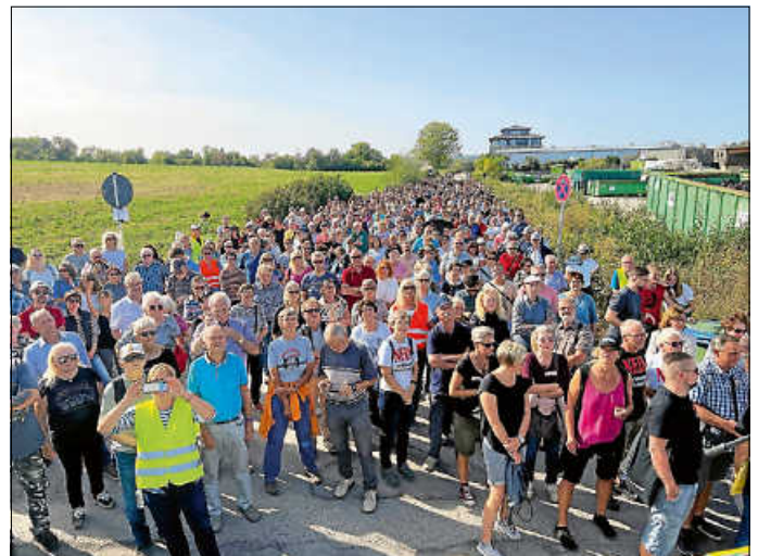
Rund 1.000 Bürgerinnen und Bürger sind dem Aufruf der Interkommunalen Gemeinderatsinitiative gefolgt.

Die ablehnende Haltung zu den Plänen des Landes und die Gründe hierfür wurden dabei nochmals deutlich zum Ausdruck gebracht. Sei es die fehlende Erschließung und Infrastruktur, die Bedeutung des Schanzackers als regionaler Grünzug, potentielle Sicherheitsbedenken sowie die fehlende Akzeptanz in der Bevölkerung für eine Landeserstaufnahmestelle für bis zu 1.200 Personen.