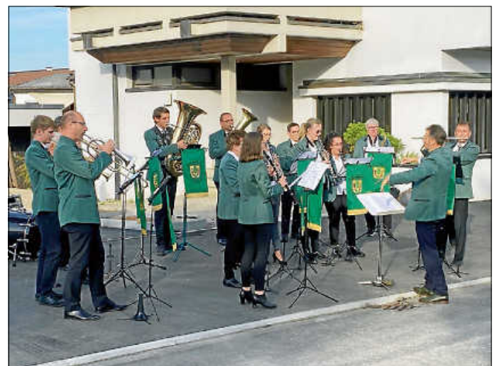
feierliche Umrahmung durch die Stadtkapelle Asperg