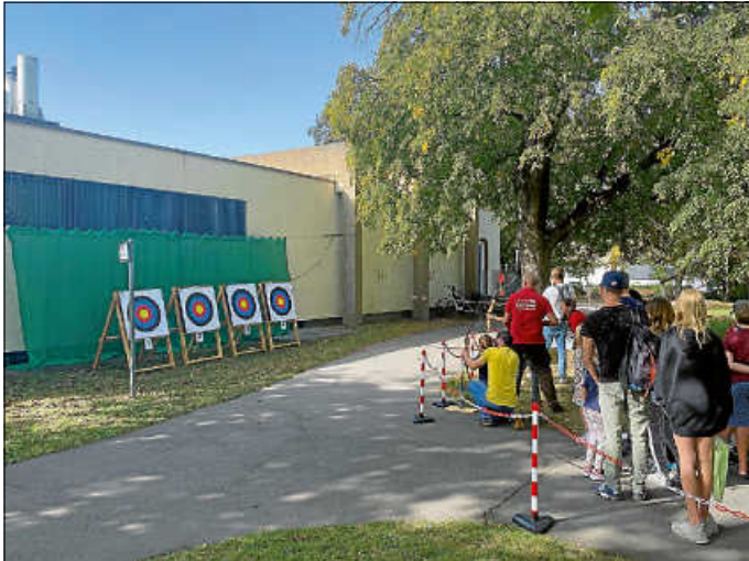
Auch im Bogenschießen konnte man sich ausprobieren.

Und auch sonst waren noch jede Menge Attraktionen geboten. Geübte und weniger Geübte konnten sich mit Pfeil und Bogen messen und Nils der Gaukler schaffte es mit seiner Feuerjonglage und seinen Zaubereien, vor allem die kleinen Besucher in Staunen zu versetzen.