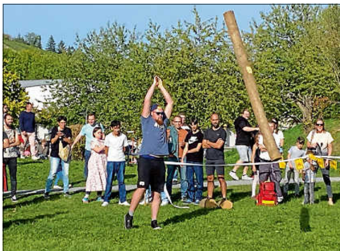
Präzision war unter anderem auch beim Baumstammwerfen angesagt.

Nach der Parade durch den gesamten Bürgergarten starteten dann schließlich auch die Heavy Events mit Baumstammwerfen, dem Farmers Walk, Steinestoßen und Hufeisenzielwurf. Kraft, Konzentration und Geschicklichkeit waren dabei gleichermaßen gefordert. So galt es zum Beispiel, den „Timber“, also den Baumstamm, so in die Luft zu befördern, dass er sich einmal um die eigene Achse drehte und auf 12 Uhr zum Liegen kam. Nicht ganz leicht, wie viele feststellen mussten. Aber auch hier stand das Motto „Dabei sein ist alles!“ im Vordergrund.