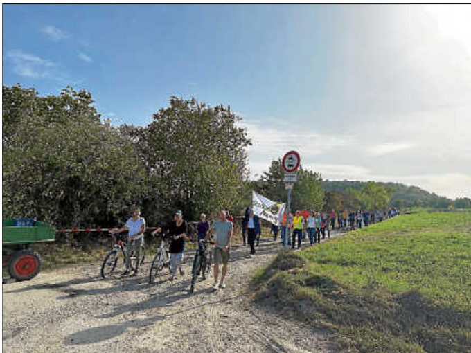
Ankunft des Sternmarsches aus Richtung Asperg

Am vergangenen Sonntag, 8. Oktober 2023 rief die fraktionsübergreifende und interkommunale Gemeinderatsinitiative Asperg/Tamm zum Sternmarsch auf den Schanzacker auf. Erneut folgten rund 1.000 Bürgerinnen und Bürger dem Aufruf. Treffpunkte waren das Kleintierzüchterheim in Asperg und der Parkplatz beim Sportplatz im Tamm.