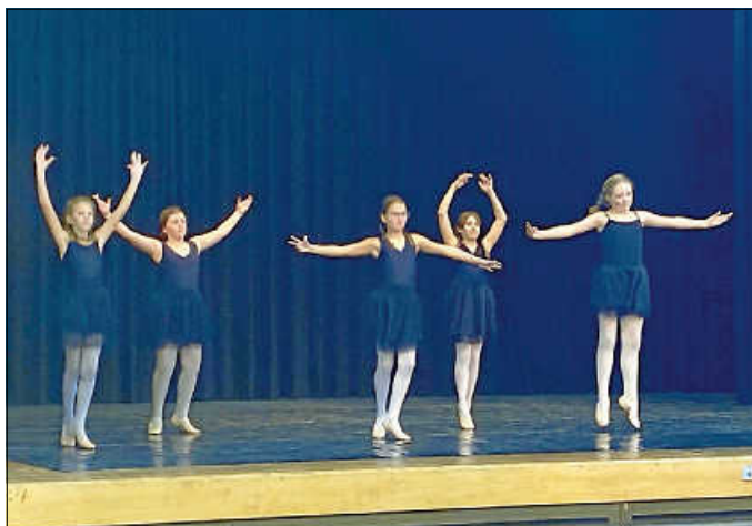
Schottische Folkloretänze zeigte die Asperger Tanzbühne Dance Stage.

Die Asperger Tanzbühne Dance Stage ließ die Vielzahl an schottischen Eindrücken sogar in die angrenzende Stadthalle überschwappen. Dort gab es original schottische Tänze zu sehen. Das Publikum dankte es mit großem Applaus.