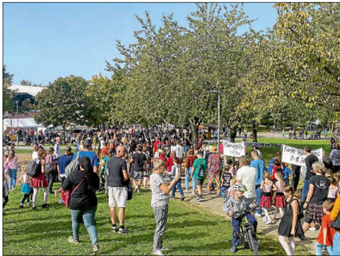
In Strömen zog es die Asperger am vergangenen Wochenende zu den Highlandgames in den Bürgergarten.

Unter dem Motto „Gemeinsam stark für Asperger Kids“ veranstaltete die städtische Kinder- und Jugendarbeit mit zahlreichen Kooperationspartnern am Samstag, 7. Oktober und Sonntag, 8. Oktober 2023 im Bürgergarten die 15. Asperger Highlandgames.