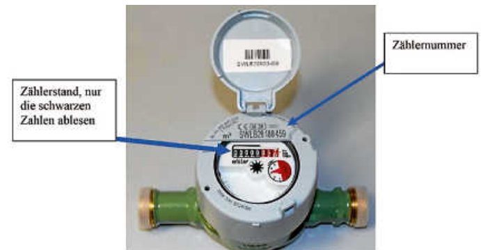
Foto: Muster eines Wasserzählers