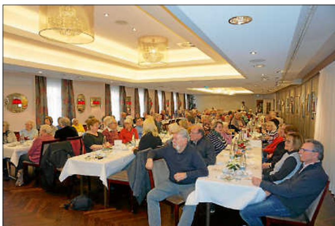
Voll besetztes Haus bei der städtischen Seniorenweihnachtsfeier

Rund 150 Seniorinnen und Senioren sind am Dienstag, 5. Dezember, der Einladung von Stadtverwaltung und Gemeinderat zur städtischen Seniorenweihnachtsfeier gefolgt. Erstmals im großen Saal des Hotels und Restaurants Adler, dauerte es gerade einmal zwei Werkstage, bis alle kostenlosen Einlasskarten restlos vergriffen waren.