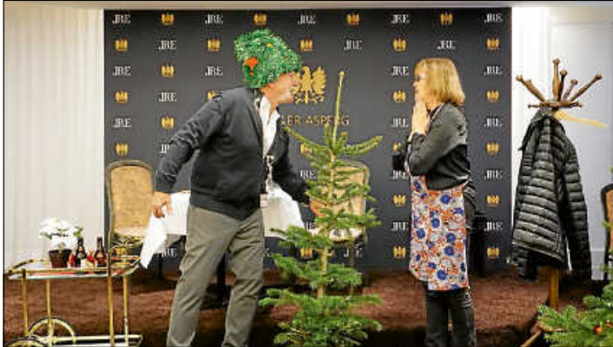
Die Schwabenbühne sorgte wieder einmal für beste Unterhaltung

Gemeinderat und Stadtverwaltung wünschen allen Seniorinnen und Senioren nochmals eine besinnliche Adventszeit, frohe Weihnachten sowie ein gutes und gesundes Jahr 2024.