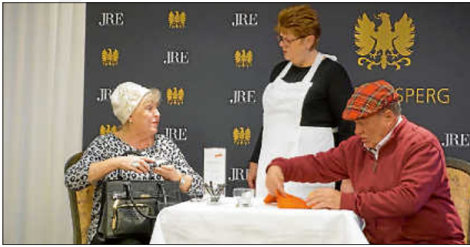
Fester Bestandteil einer jeden Seniorenweihnachtsfeier: Sketche aus dem Alltagsleben, made by Schwabenbühne Asperg