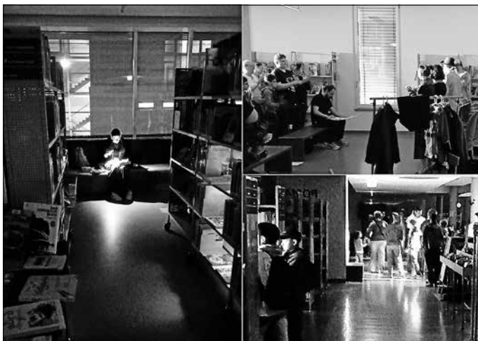
Grafik + Foto: Stadtbücherei

Auch wenn beim Bilderbuchkino die Konkurrenz durch Eisdiel und Spielplatz bei schönstem Frühlingwetter noch deutlich zu spüren war, füllten sich für die Aufführung der Phantasykids schnell die Plätze. Das Publikum durfte die Grand Dame des Krimis - Agatha Christie - live beim Lösen eines kniffligen Falls erleben. Die jungen Schauspielerinnen überzeugten in ihren Rollen und konnten die Spannung bis zum überraschenden Ende aufrecht halten. Entsprechend groß war auch der wohlverdiente Applaus!