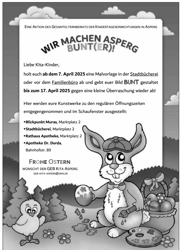
Plakat: Gesamtelternbeirat Kindertageseinrichtungen

WÜNSCHT DER GEB KITA ASPERG GEB-KITA-ASPERG@GMAIL.DE