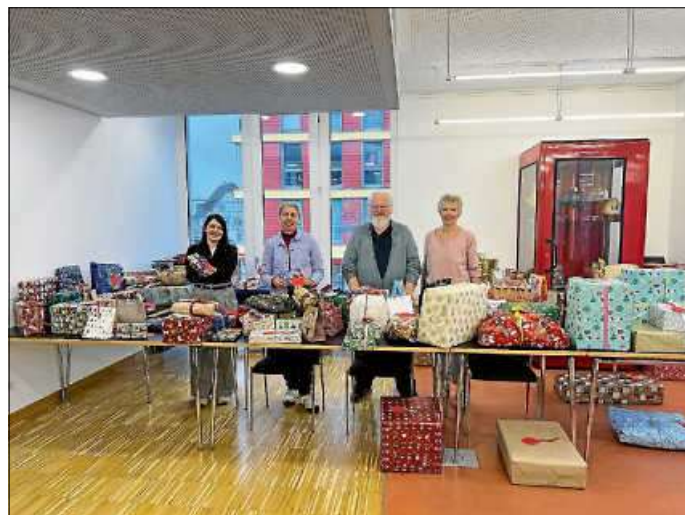
Foto: Weihnachtswunschbaum 2024

Wünschen - Weihnachten steht vor der Tür, aber für Weihnachtsgeschenke fehlt das Geld?