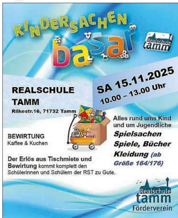
Plakat: Andreas Schreiner