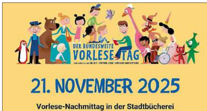
Plakat: Stadtbücherei Asperg; Stiftung Lesen

Durch Vorlesen lernen Kinder, wie Sprache funktioniert. Es trainiert Denken und Konzentration, lässt kreativer werden und fördert das Einfühlungsvermögen. Allerdings unterschätzen viele Erwachsene, wie wichtig das Vorlesen für den gesamten Leseweg von Kindern ist. Das Motto des Bundesweiten Vorlesetages 2025 unterstreicht, wie vielseitig Vorlesen ist und zeigt gleichzeitig, dass jede einzelne Sprache und Stimme zählt. Denn Geschichten wirken universell. Sie schaffen Verstehen, fördern den Austausch, stärken das Miteinander und legen die Grundlage zum Lesenlernen. Das Motto hebt die verbindende Kraft des Vorlesens hervor und sendet eine klare Botschaft: Nutz deine Sprache, nutz deine Stimme und lies vor!