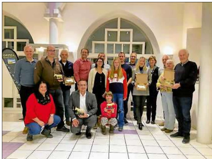
Alle Preisträger der Esel-Plakette und des Gold-Esels

Die sogenannte Esel-Plakette wird in fünf Kategorien vergeben: Solar, Heizung, Mobilität, Dämmung und Umwelt. Wer in allen fünf Themenfeldern aktiv geworden ist und dafür jeweils einen Token erhalten hat, wird mit dem Gold-Esel ausgezeichnet.