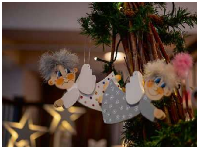
Künstlermarkt im Glasperlenspiel.