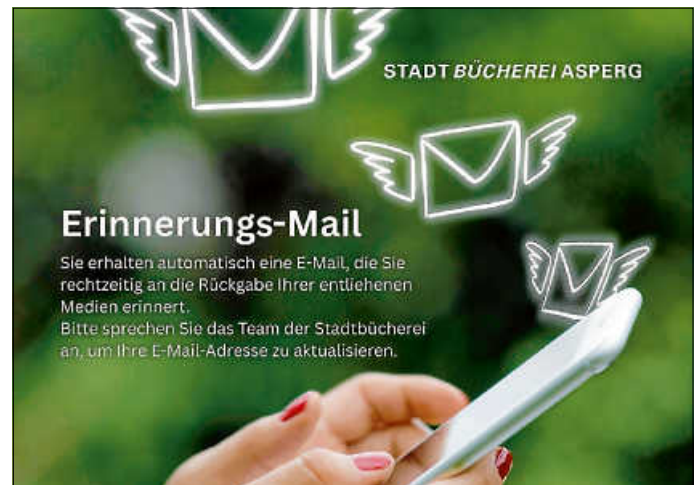
Plakat: Stadtbücherei Asperg

Alle Gebühren und die ausführlichen Nutzungsbedingungen sind auf der Homepage der Stadtbücherei, im Ratsinformationssystem der Stadt Asperg und den neuen Flyern und Benutzungsinformationen in der Stadtbücherei zu finden.