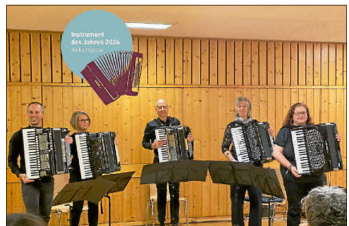
Das Ensemble InQuin

Am Dienstag, 9. Juni, startet die Stadtbücherei um 19:30 Uhr im Keltensaal mit einem kleinen Festabend in die Jubiläumswochen.