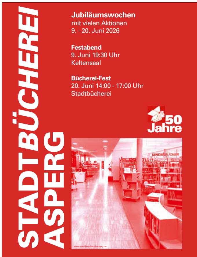
Plakat: Stadtbücherei Asperg

Nach einer Stunde war, dank der tatkräftigen Mithilfe aller, schnell wieder abgebaut und aufgeräumt und die ganze Gesellschaft konnte planmäßig bei trockenem und mildem Wetter, noch auf den benachbarten Spielplatz wechseln, wo die Kinder sich austoben und gemeinsam spielen konnten. Die Eltern und Patenomas nutzten derweil die Zeit, ihre Gespräche weiterzuführen und zu vertiefen. Wer es lieber ruhig und kreativ mochte, konnte mit Frau Frank kleine Holzselchen für den Zaun des FambIA oder als Souvenir für zuhause bemalen.