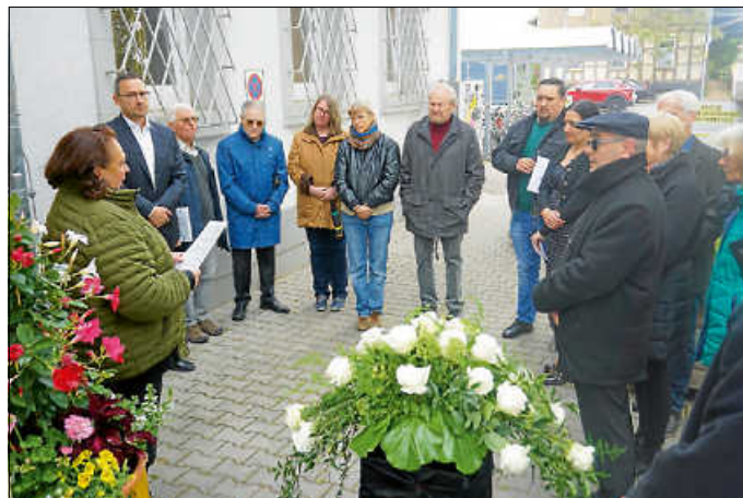
Am Samstag, 16.05.2026 gedachte die Stadt Asperg der Deportation der Sinti und Roma in die Vernichtungslager im Osten