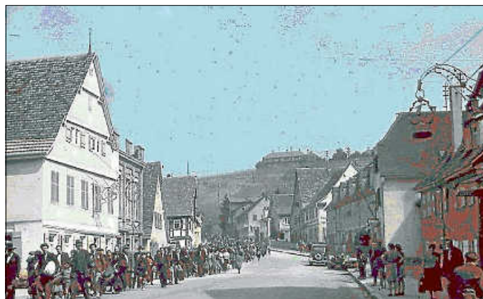
Weg der Sinti und Roma vom Hohenasperg durch die Stadt zum Bahnhof

Wie die historischen Bilder vom Mai 1940 zeigen, beschränkten die Sinti- und Roma-Familien den Weg durch die Stadt zum Bahnhof am helllichten Tag, auch vor den Augen einiger am Straßenrand stehender Asperger Bürger.