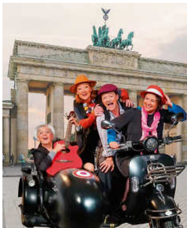
50 Jahr blondes Haar.