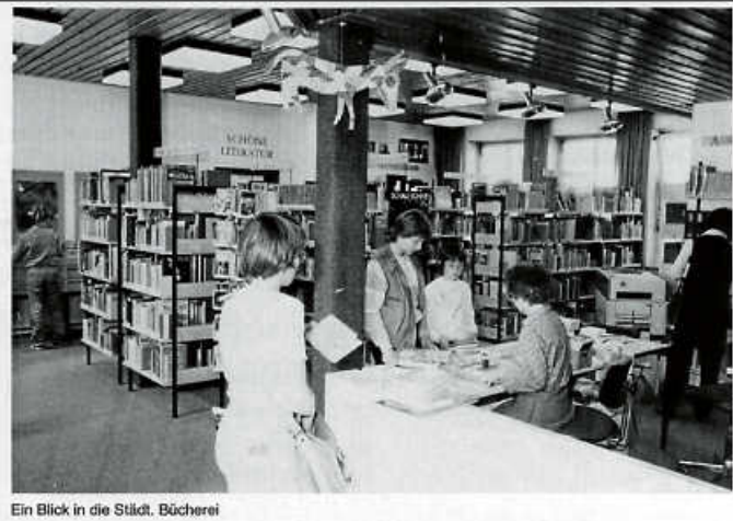
Ein Blick in die Städt. Bücherei

Am 26. Mai 1976 wurde im ehemaligen Gebäude der Kreissparkasse in der Badstraße die Stadtbücherei Asperg eröffnet. Mit etwa 4000 Büchern für Kinder, Jugendliche und Erwachsene.