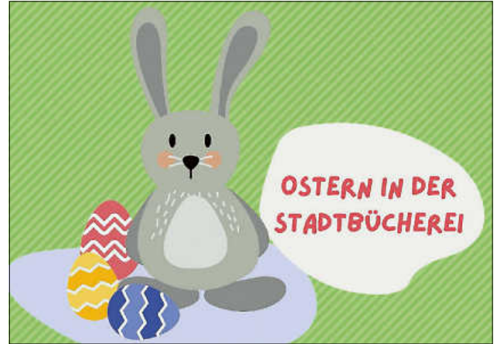
Grafik: Stadtbücherei Asperg

Der Gesamtelternbeirat der Kindertagesstätten macht Asperg wieder bunt(er): KiTa-Kinder erhalten vom 23. März bis 2. April im Familienbüro oder der Stadtbücherei österliche Ausmalbilder. Gegen eine kleine Überraschung kann ein fertig ausgemaltes Bilder dann im selben Zeitraum bei der Apotheke Dr. Dorda, Flegel Augenoptik, der Rathaus-Apotheke, Sternschnuppe Naturkost oder der Stadtbücherei abgegeben werden. Die Kunstwerke verschönern dann zu Ostern die Schaufenster.