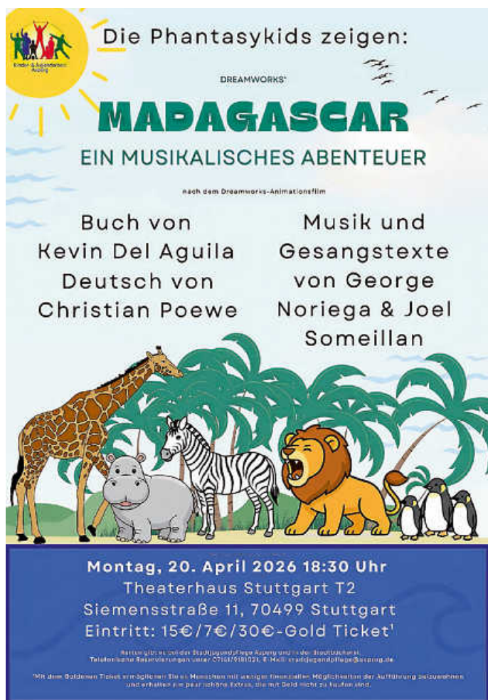
Plakat: Louis Mehlin

Am kommenden Montag, den 20. April zeigen die Phantasykids Asperg ihr aktuelles Stück „Madagascar – ein musikalisches Abenteuer“ nach der berühmten Dreamworks-Filmvorlage.