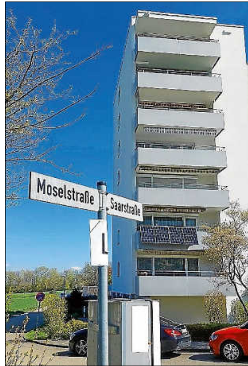
Beispiel für die Buchstabensuche

Wenn Sie alle vier Buchstaben gefunden haben, setzen Sie daraus ein Lösungswort zusammen. Bitte reichen Sie dieses zusammen mit mindestens einem Foto eines gefundenen Buchstabens vor Ort ein.