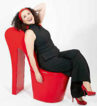
Anette Heiter: Wolkenfreie Comedy.

Mittwoch, 13.05. – 20.00 Uhr – Eintritt frei, Spende erbeten