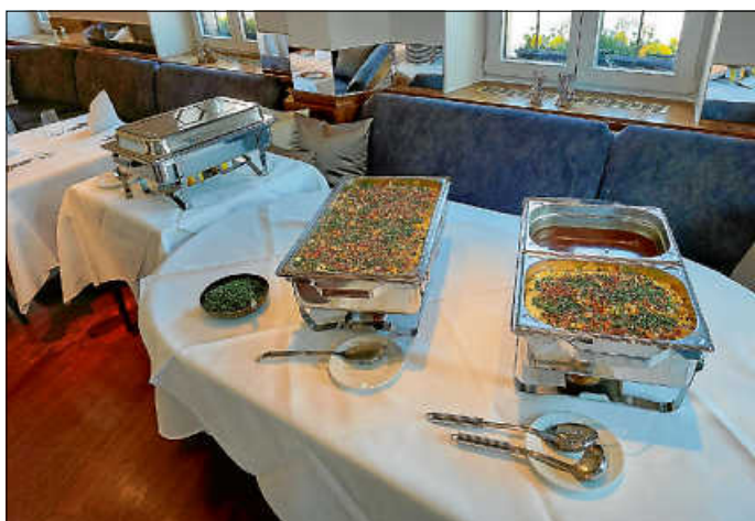
Essen im Adler

lernten die Austauschschüler und die Gastgeber das traditionelle Brezelbacken. Zur großen Freude aller durften die selbst gemachten Backwaren nicht nur backfrisch probiert, sondern in großen Tüten voller Leckereien mit nach Hause genommen werden.